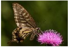
アゲハチョウとアザミ