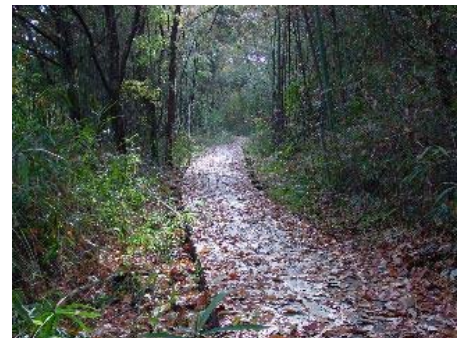
落ち葉があふれる凹池脇の木道